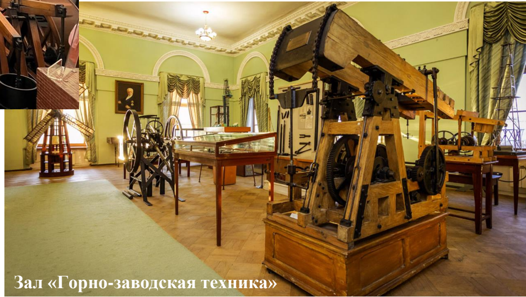
Зал «Горно-заводская техника»

Фонды музея насчитывают около 230 тысяч экспонатов, среди которых редчайшие минералы, ювелирные камни, металлы, крупнейшая коллекция метеоритов, исторические и действующие макеты и модели горной техники , палеонтологическое собрание, документы по истории Университета.